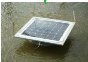
ソーラー水浄化装置