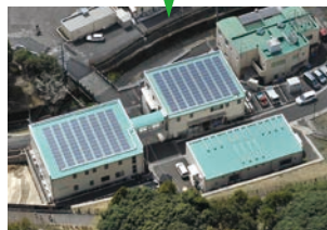
みんなの発電所 コミュニティソーラー